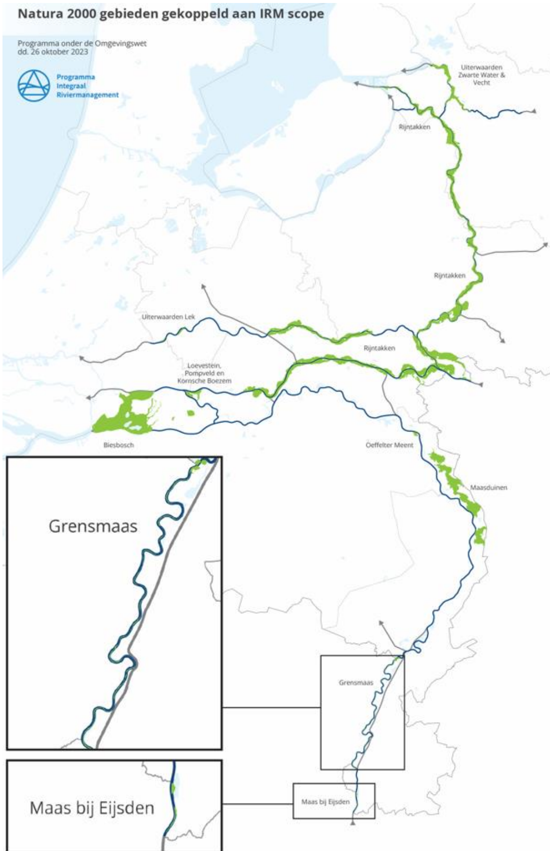
Figure 3-1 Localisation des sites Natura 2000 dans le cadre de l'IRM