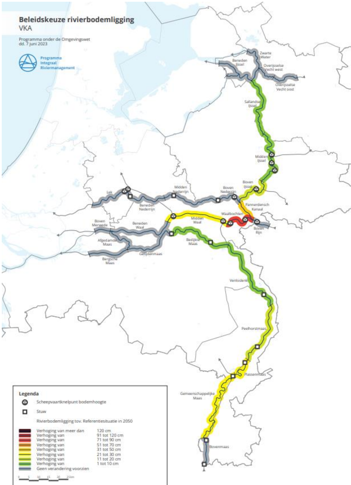
Figure 4-1 Options politiques pour l'emplacement de lit de la rivière