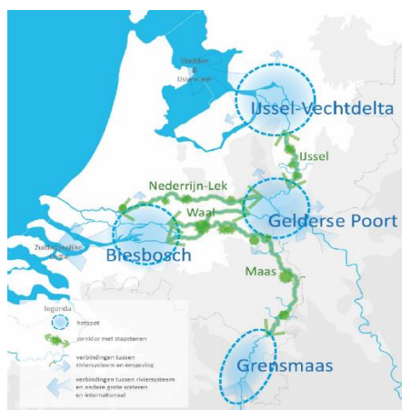
Figure 4-4 Illustration du réseau naturel des grandes rivières (Heusden et al., 2021)

Un réseau naturel composé de quatre zones centrales (zones sensibles) est visé, dont deux se situent entièrement et deux partiellement dans la zone de planification de l'IRM (voir Figure 4-4). Les zones centrales sont reliées entre elles par des rivières (corridors et gués). Seule la zone centrale entourant la Gelderse Poort a peu de chances d'être entièrement aménagée en extérieur de digue. Pour cela seront nécessaires des réserves Barro supplémentaires et des zones en intérieur de digue.